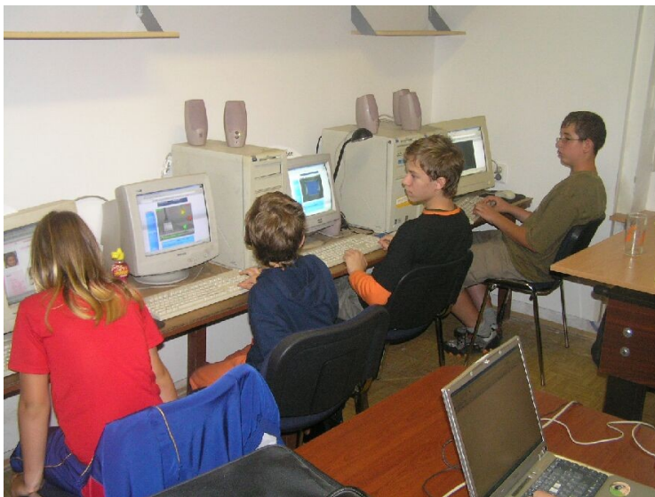
Zájem je stále o příměstské internetové tábory